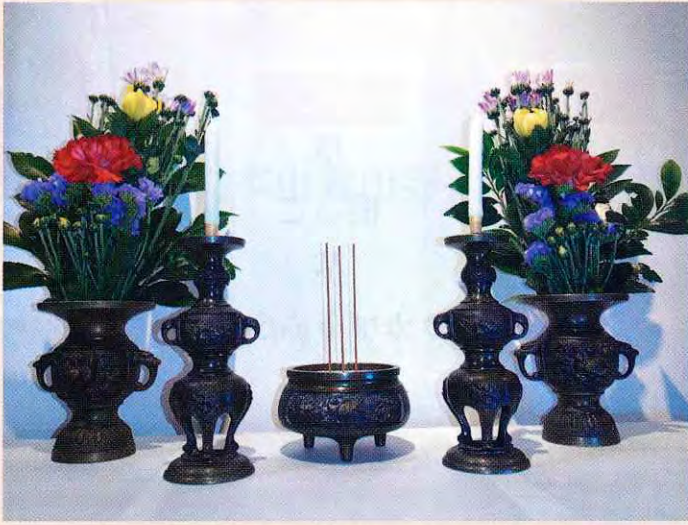
花 ローソク 線香 ローソク 花