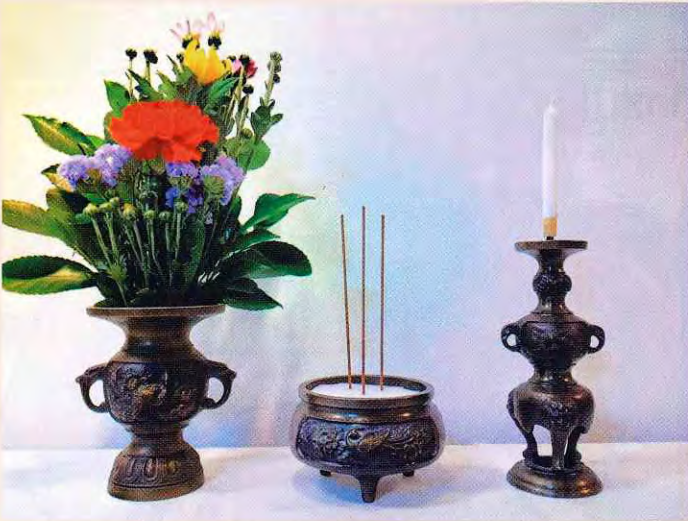
花 線香 ローソク